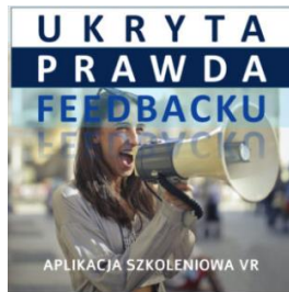
UKRYTA PRAWDA FEEDBACKU – aplikacja szkoleniowa VR – licencja