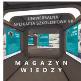
MAGAZYN WIEDZY – uniwersalna aplikacja szkoleniowa VR – licencja

System automatyzacji procesów szkoleniowych i biznesowych: