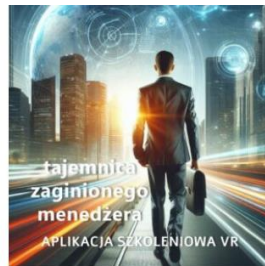
TAJEMNICA ZAGINIONEGO MENEDŻERA – gra szkoleniowa VR